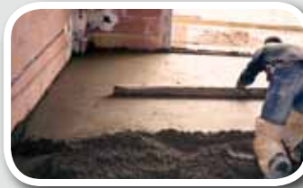
SOLERAS DE MORTERO